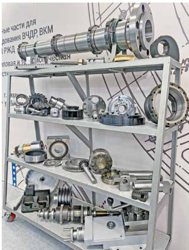
Рис. 1. Запчасти для станков 1М63, 1Н65, 16К40, а также revolverных головок 1П756ДФ3, 16М30/16К30

Отдельное внимание на выставке мы уделили презентации запасных частей для колесотокарных и токарно-накатных станков: нами был представлен шпиндельный узел станка УВВ-112 (рис. 4) с входящими в него запчастями, а также поводок и секторы зажима колесных пар, гидрозажим шпиндельной бабки, коническая пара и червячная пара подъемника колесной пары, коническая пара с круговым зубом редуктора станка КЗТС1836.