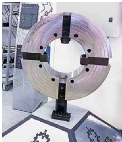
Рис. 3. Патрон \varnothing 720 мм станков 1Н983, 1А983, СА983