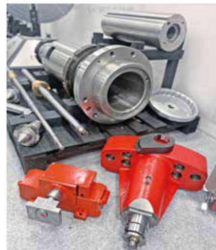
Рис. 4. Запчасти колесотокарных станков УВВ-112, РТ905

По результатам проведенных выставочных дней ООО ПКФ «СтанкоАртель» планирует расширение списка выпускаемой продукции, которую представит уже в следующем году на собственном стенде выставки «Металлообработка-2025».