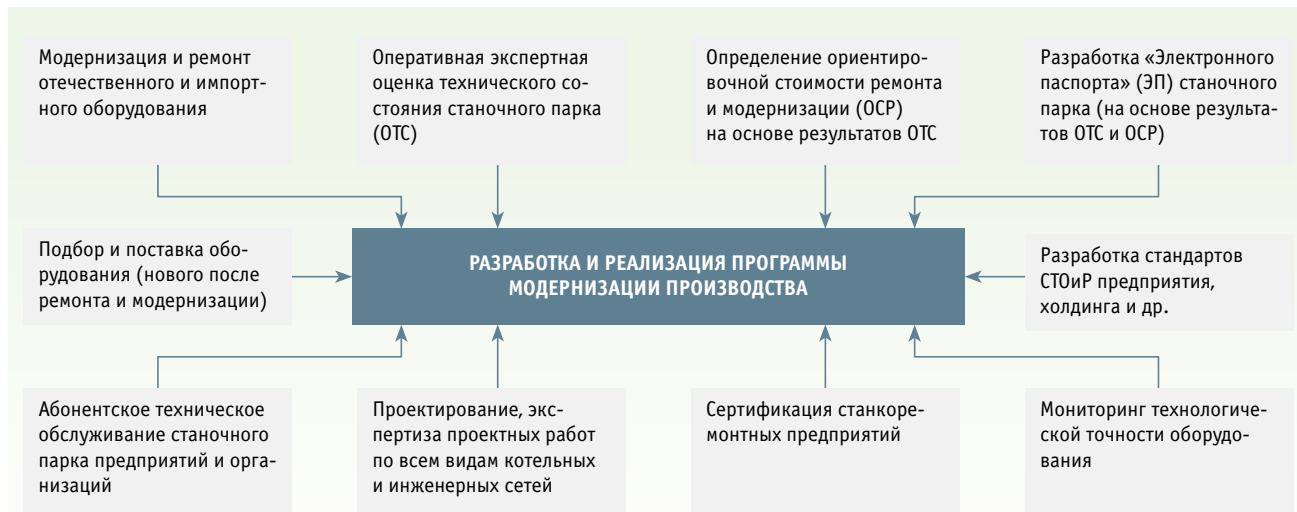
Рис. 1. Технический аудит станочного парка