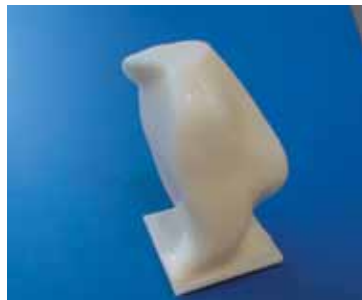
Рис. 5. Деталь «джойстик», обработанная на 5-осевом ОЦ КВС МВ 184М5 с ЧПУ «ОЛИМП»

и качества обработки, обеспечить максимальную надежность работы оборудования.