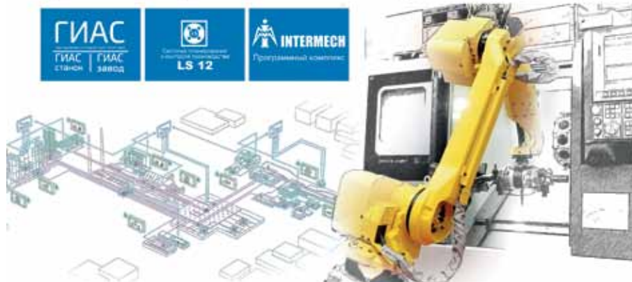
Рис. 9. Цифровое производство на базе отечественных ОЦ и ЧПУ

Цифровое производство на базе отечественных программных продуктов и современных многоцелевых обрабатывающих центров