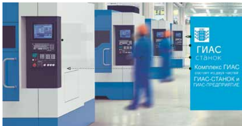
Рис. 2. Информационно-аппаратный комплекс «ГИАС»

Надо отметить, что системы ЧПУ Fanuc и Mitsubishi – это хорошо известные мировые бренды. Адаптация к ним комплекса «ГИАС» существен-