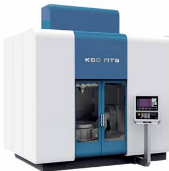
Рис. 8. 5-координатный порталный ОЦ КВС ПТ5

Цифровое производство на базе отечественных программных продуктов и современных многоцелевых обрабатывающих центров