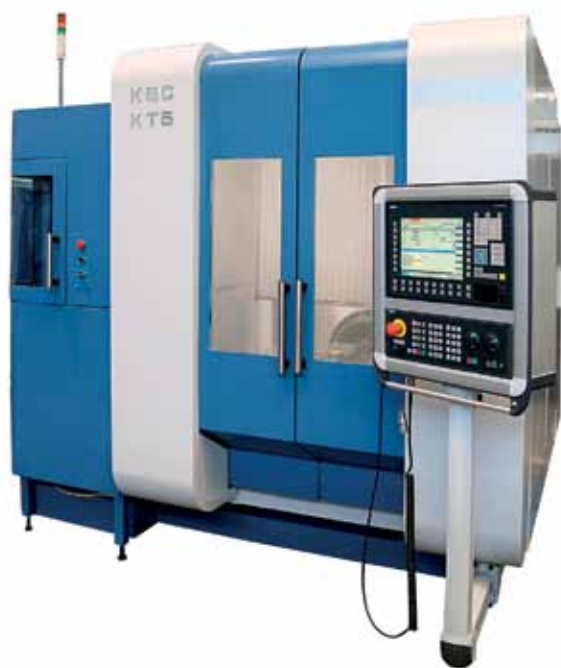
Рис. 7. 5-координатный ОЦ консольного типа КВС КТ5