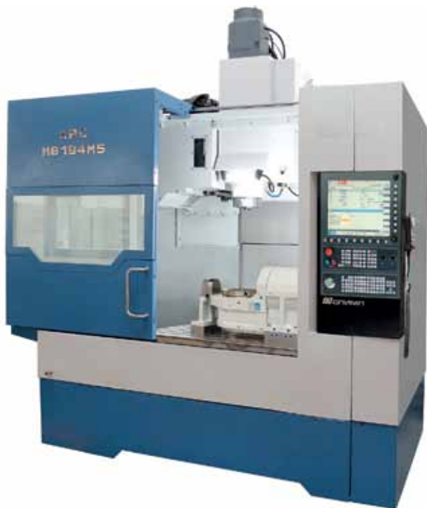
Рис. 4. Вертикально-фрезерный ОЦ КВС МВ 184М5 с отечественной системой ЧПУ «ОЛИМП»