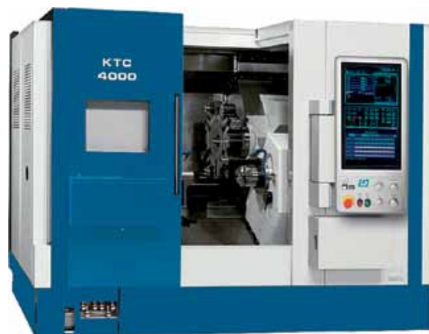
Рис. 3. Токарно-фрезерные ОЦ моделей КТС 3000 (Y/YS), КТС 4000 (Y/YS), КТС 5000 (Y/YS)

но расширяет потребительские качества обрабатывающих центров.