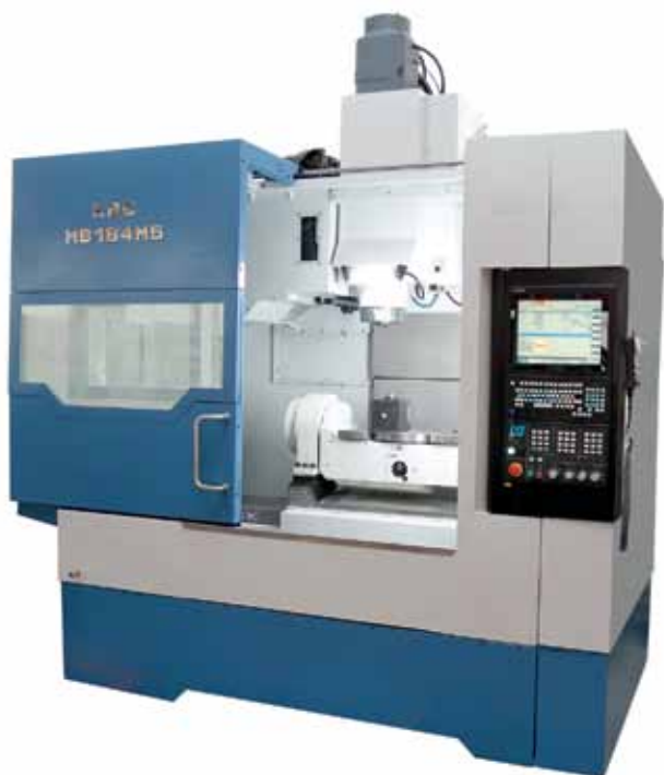
Рис. 1. Вертикально-фрезерный ОЦ модели КВС МВ184М5

Фрезерные обрабатывающие центры, оснащенные комплексом «ГИАС», прошли испытания и успешно используются в производстве.